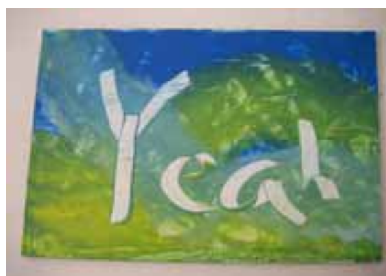
Man kan skriva text med ett radergummi.