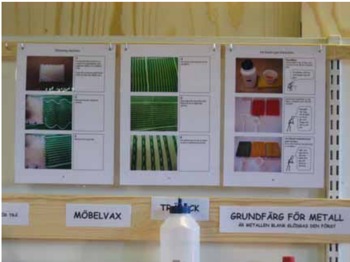
Boken innehåller mängder av instruktionsmaterial, som man kan hänga upp vid ytbehandlingsavdelningen, allt efter att de blir aktuella för elevernas arbeten.