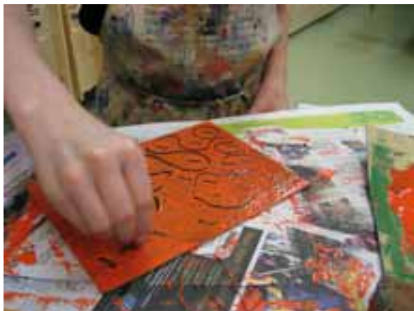
Pröva olika former på radergummi.

Klicka på bilderna för att få dem större.