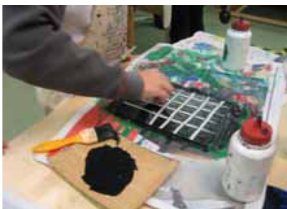
Genom att dra radergummit rakt i två riktningar, får man fram mönstret till höger.