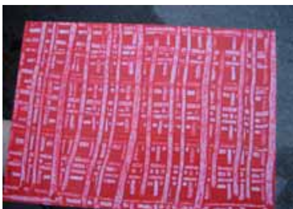
Hur har man gjort mönstret på denna skiva?