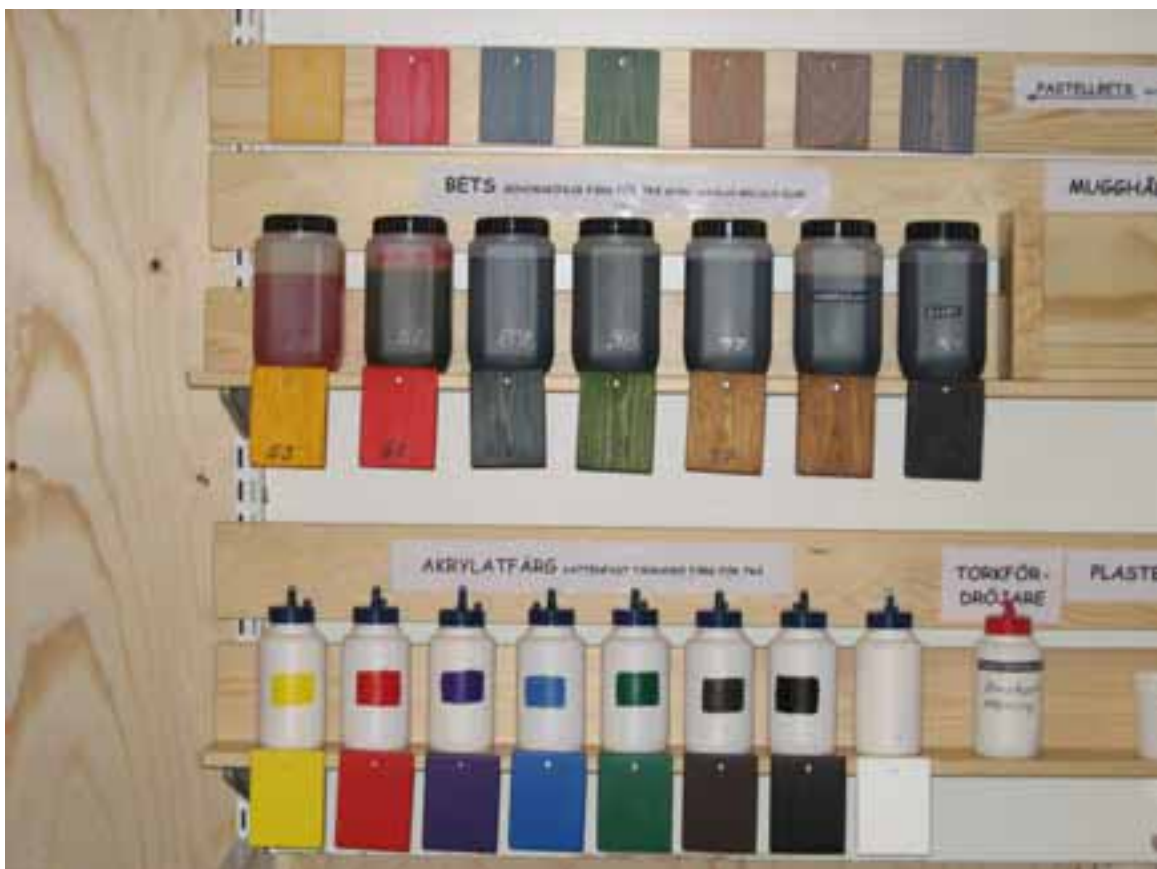
Med 7 betskulörer och 8 kulörer akrylatfärg, klarar man de flesta färgbehov i slöjden.